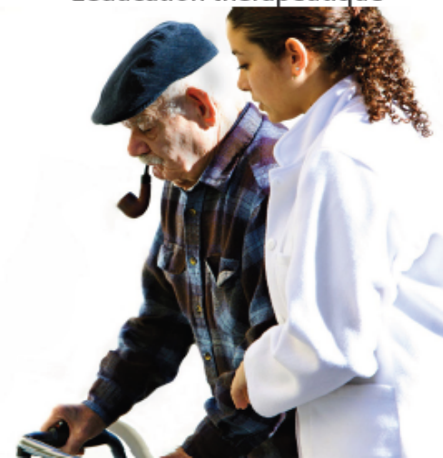
Illustration : Libre/MALIMUS - octobre 2015